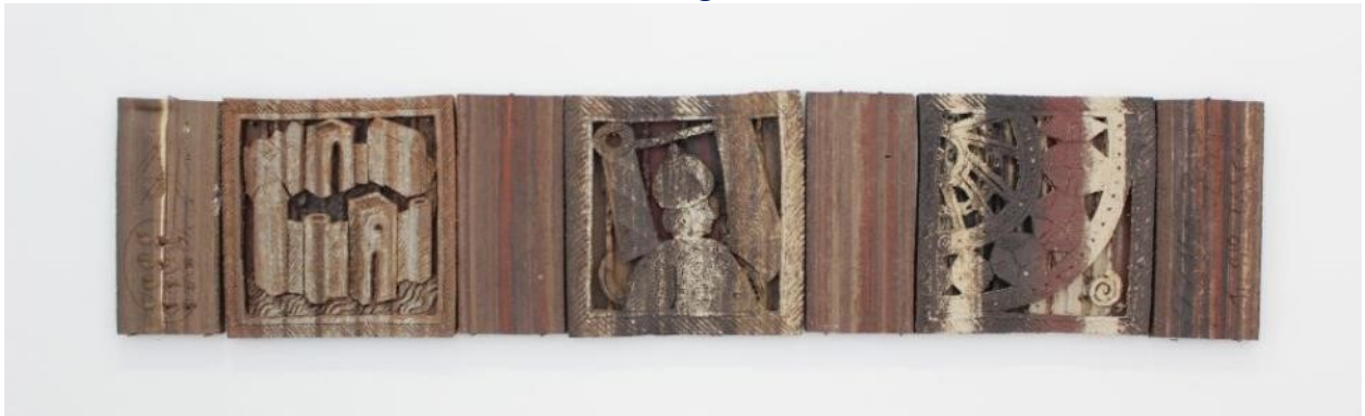
Künstler: Alessio Tasca, Projekt Klosterhof Madonna Dell'Orto, Venedig 2004

Hier nochmal das Kunstwerk der Kunstsammlung: