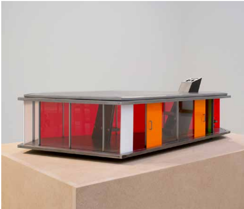
Ackermans Tempel B 2011