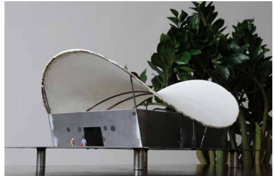
Skulpturenhalle I M 1:100, 2011