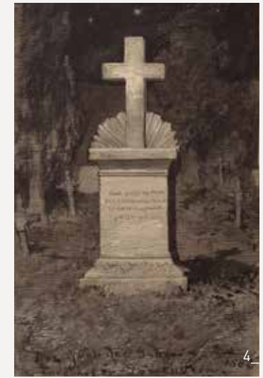
Titel Gabriel Max, Die Seherin im schauenden Zustand, 1895, © Sammlung Plock, Courtesy Kunkel Fine Art, München, Foto: Walter Bayer 1 Getuschte Silhouetten von Justinus Kerner und Friederike Hauffe, o. J., © und Foto: Landesmedienzentrum Baden-Württemberg, Stuttgart/Karlsruhe 2 Ludwig Mayer (Zeichner), Samuel Lacey (Stecher), Ansicht „Weinsberg“ mit Kernerhaus und Weibertreu, 1836, © und Foto: Stadtarchiv Heilbronn 3 Justinus Kerner, Kerner beim Maultrommelspielen von einer Erscheinung überrascht, o. J., verschollen 4 Gabriel Max, Das Grab der Seherin am Friedhof zu Löwenstein, 1882, © und Foto: Münchner Stadtbibliothek/Monacensia 5 Justinus Kerner: Klecksographie, 1850er Jahre, © Städtische Galerie im Lenbachhaus und Kunstbau München, Foto: Lenbachhaus, Ernst Jank

Zur inhaltlichen Vertiefung bietet sich ein Besuch des Kernerhauses in Weinsberg an, aus dem maßgebliche Leihgaben für die Ausstellung stammen.