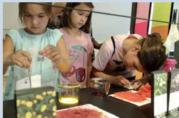
Mitmach-Station „Färben“ Stadt- und Industriemuseum Rüsselsheim

Sa | 29.04. | 11:30-15 Uhr Gib Stoff! trifft Maker Space (ab 14 Jahren) „Stoffe designen und bedrucken“ Den Startpunkt bildet eine Mitmach-Führung in der Sonderausstellung. Im Anschluss gestaltet ihr eine Stofftasche mit Siebdrucktechnik im Maker Space. In Kooperation mit der experimenta Heilbronn. Kostenfrei zzgl. Eintritt und Beitrag Maker Space 8 Euro. Anmeldung erforderlich