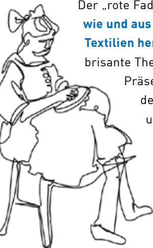
Textilberufe früher und heute: Weißnäherin

Mit Lust am Experimentieren können Kinder ab fünf Jahren, Jugendliche und Erwachsene in der Ausstellung designen, stricken, weben, knüpfen und beim Besuch des Kleiderkreisels sogar nachhaltig tauschen statt kaufen. Für Kitagruppen und Schulklassen gibt es spezielle Workshop-Angebote.