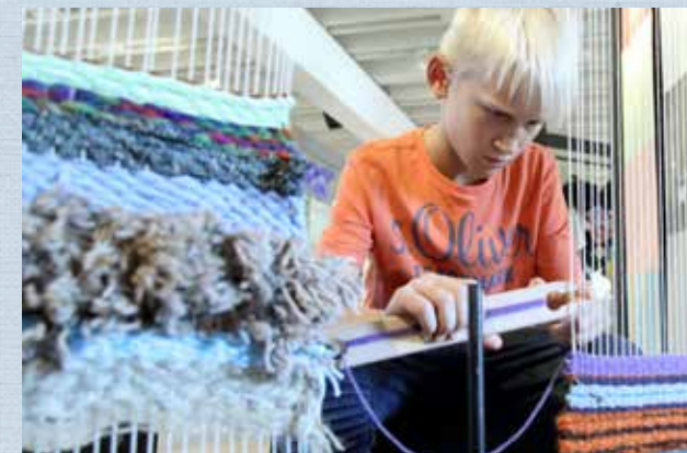
Mitmach-Station „Weben“ Stadt- und Industriemuseum Rüsselsheim

Sa | 03.06. | 11:30-15 Uhr Gib Stoff! trifft Maker Space (ab 14 Jahren) „Fashion-Freaks gesucht!“ Den Startpunkt bildet eine Mitmach-Führung in der Sonderausstellung. Im Anschluss lernt ihr die Nähmaschinen im Maker Space kennen und fertigt eure ersten individuellen Textilprojekte an. In Kooperation mit der experimenta Heilbronn. Kostenfrei zzgl. Eintritt und Beitrag Maker Space 8 Euro. Anmeldung erforderlich