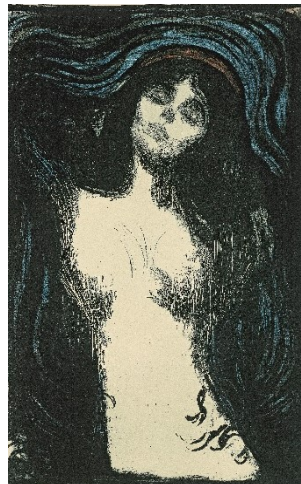
Edvard Munch, Madonna – Liebedes Weib, 1895–1902 Farblithografie auf Papier Sammlung Selinka, c/o Kunstmuseum Ravensburg