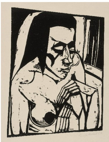
Erich Heckel, Hockende, 1913/14 Holzschnitt auf Bütten Sammlung Selinka, c/o Kunstmuseum Ravensburg