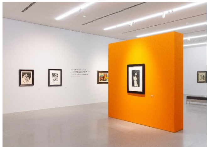
Ausstellungsansicht Perlen & Pralinen. Erlesene Werke auf Papier 1900–1930

Die Pressebilder stehen für Sie zum Download in unserem Pressebereich unter museen.heilbronn.de bereit und können im Rahmen der Berichterstattung über die Ausstellung sowie unter Angabe der Credits kostenfrei verwendet werden.