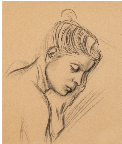
Karl Hubbuch, Frauenkopf, um 1928/29 Bleistift auf Papier Dauerleihgabe aus Privatbesitz, c/o Städtische Museen Heilbronn