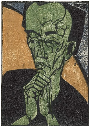
Erich Heckel, Männerbildnis, 1919 Holzschnitt auf Maschinenbütten Sammlung Selinka, c/o Kunstmuseum Ravensburg © VG Bild-Kunst, Bonn 2023 Foto: Thomas Weiss, Ravensburg