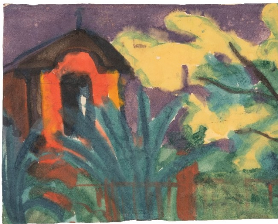
Emil Nolde, Italienische Landschaft mit rotem Haus, um 1924 Aquarell auf Japanpapier Dauerleihgabe aus Privatbesitz, c/o Städtische Museen Heilbronn © VG Bild-Kunst, Bonn 2023