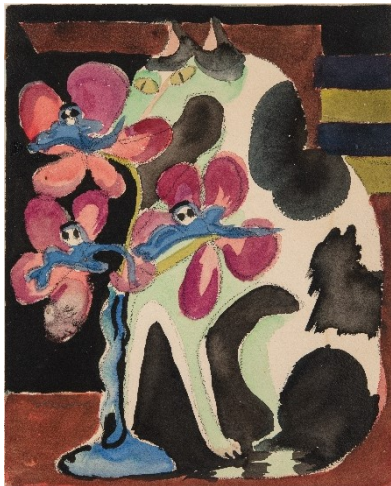
Ernst Ludwig Kirchner, Orchideen und Katze, 1920er Jahre Aquarell und Kreide auf Papier Dauerleihgabe aus Privatbesitz, c/o Städtische Museen Heilbronn Foto: Frank Kleinbach, Stuttgart

© VG Bild-Kunst, Bonn 2023 Foto: Thomas Weiss, Ravensburg