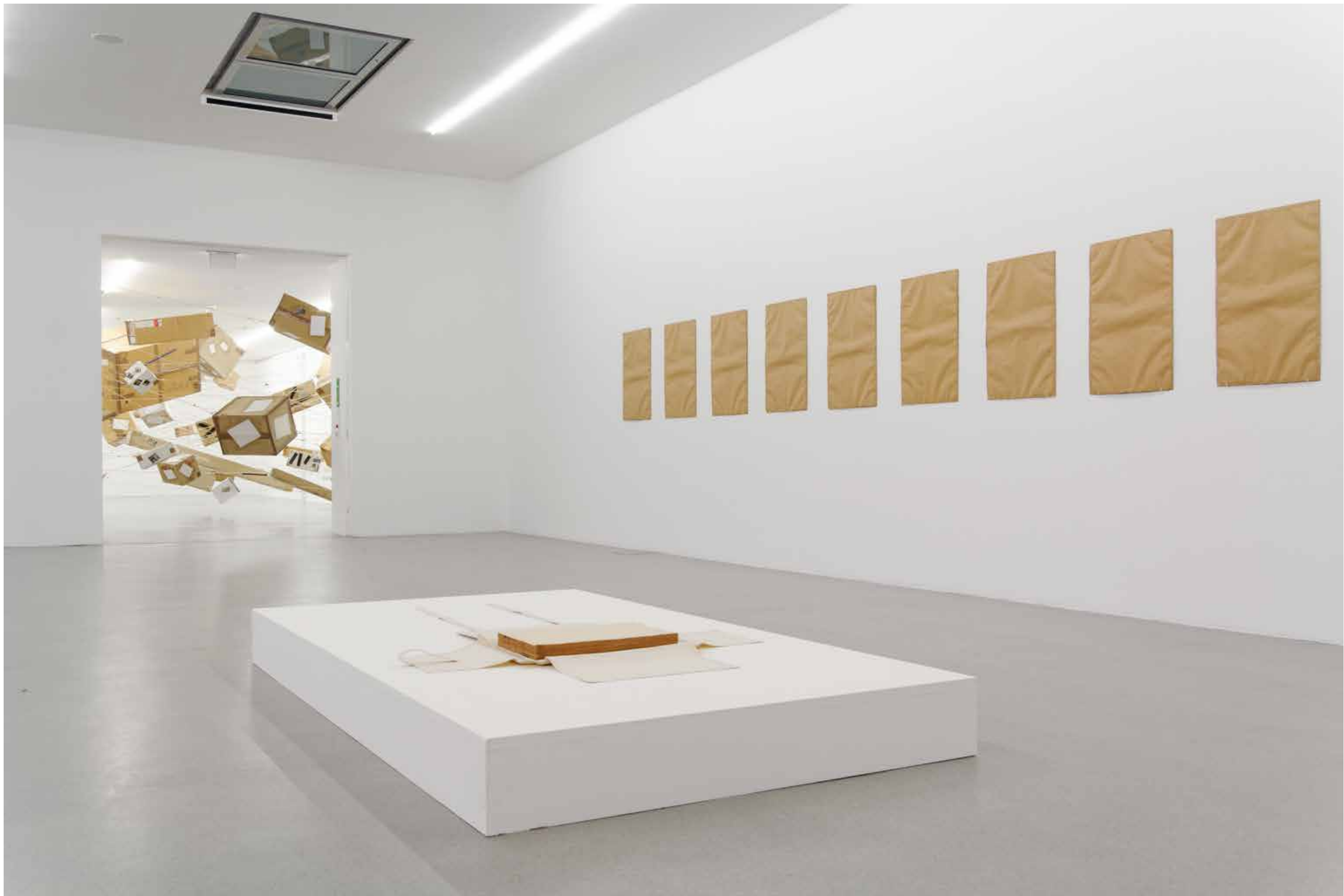
Franz Erhard Walther, im Vordergrund 335 Blatt Papier in einer Kasette, 1962/63, an der Wand 12 Packpapierklebungen, 1963