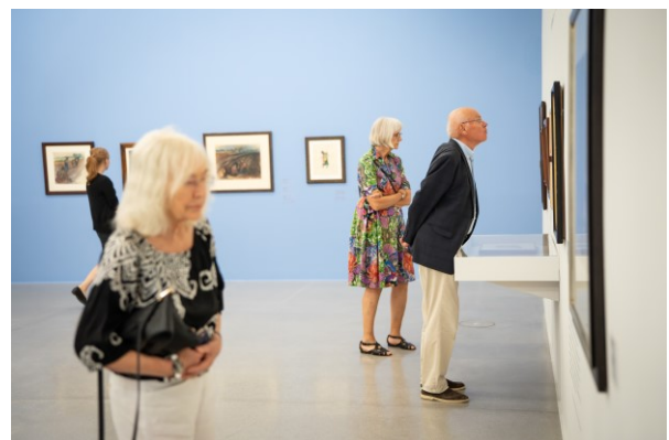
Ausstellungsansicht 4 Elfriede Lohse Wächtler – Ich als Irrwisch