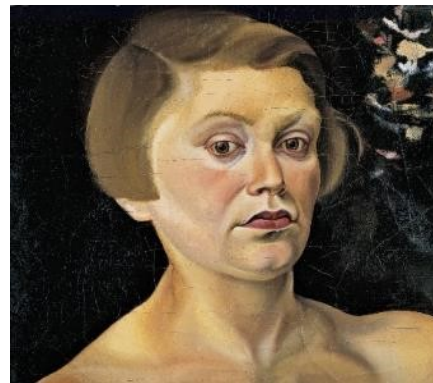
Elfriede Lohse-Wächtler, Selbstbildnis, 1931 Öl auf Leinwand Hamburger Kunsthalle, Leihgabe aus einer Privatsammlung