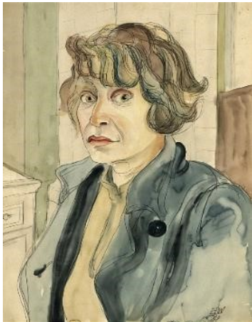
Elfriede Lohse-Wächtler, Im blauen Kittel – Selbstporträt IV, 1929 Aquarell auf Papier Privatbesitz