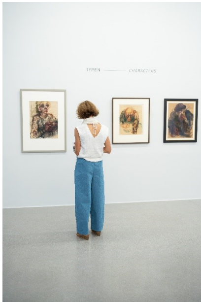
Ausstellungsansicht 1 Elfriede Lohse Wächtler – Ich als Irrwisch