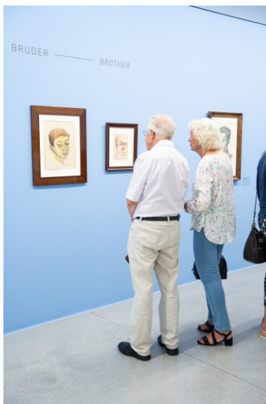
Ausstellungsansicht 3 Elfriede Lohse Wächtler – Ich als Irrwisch