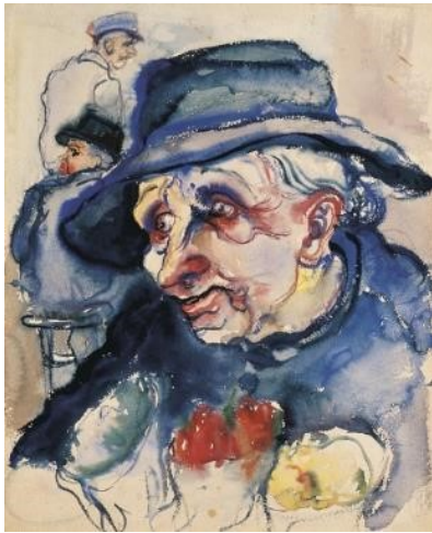
Elfriede Lohse-Wächtler Die Blumenalte, 1930

Aquarell über Bleistift Privatbesitz