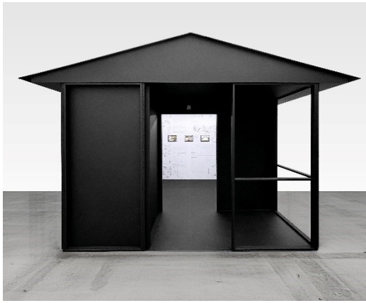
Andrea Pichl Gartenlaube GL 19, 2024 © VG Bild-Kunst, Bonn 2026 Foto: Marcus Bahra, Berlin