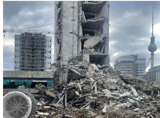
Andrea Pichl Zeitgeist II, 2012/2026 © VG Bild-Kunst, Bonn 2026 Foto: Andrea Pichl, Berlin