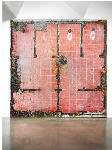
Andrea Pichl Klohäuschen aus der Serie „Plänterwald“, 2024 © VG Bild-Kunst, Bonn 2026