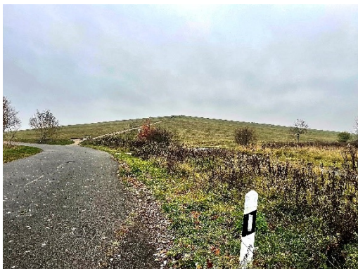
Andrea Pichl aus der Serie „Blühende Landschaften“, 2025 © VG Bild-Kunst, Bonn 2026 Foto: Andrea Pichl, Berlin