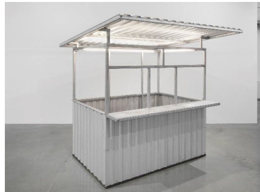
Andrea Pichl Kassenhäuschen aus der Serie „Plänterwald“, 2024 © VG Bild-Kunst, Bonn 2026

Die Pressebilder stehen für Sie zum Download in unserem Pressebereich unter museen.heilbronn.de bereit und können im Rahmen der Berichterstattung über die Ausstellung sowie unter Angabe der Credits kostenfrei verwendet werden. Das Bildmaterial darf nicht verfremdet abgebildet und nicht an Dritte weitergegeben werden. Einstellungen auf Websites bitte nur in einer Auflösung von 72 dpi.